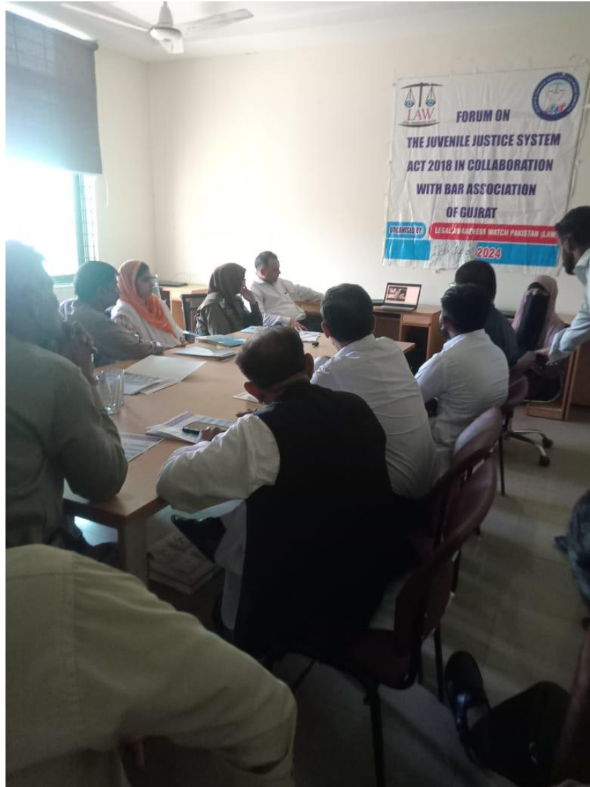
Photo from the forum/session on juvenile justice in Gujarat