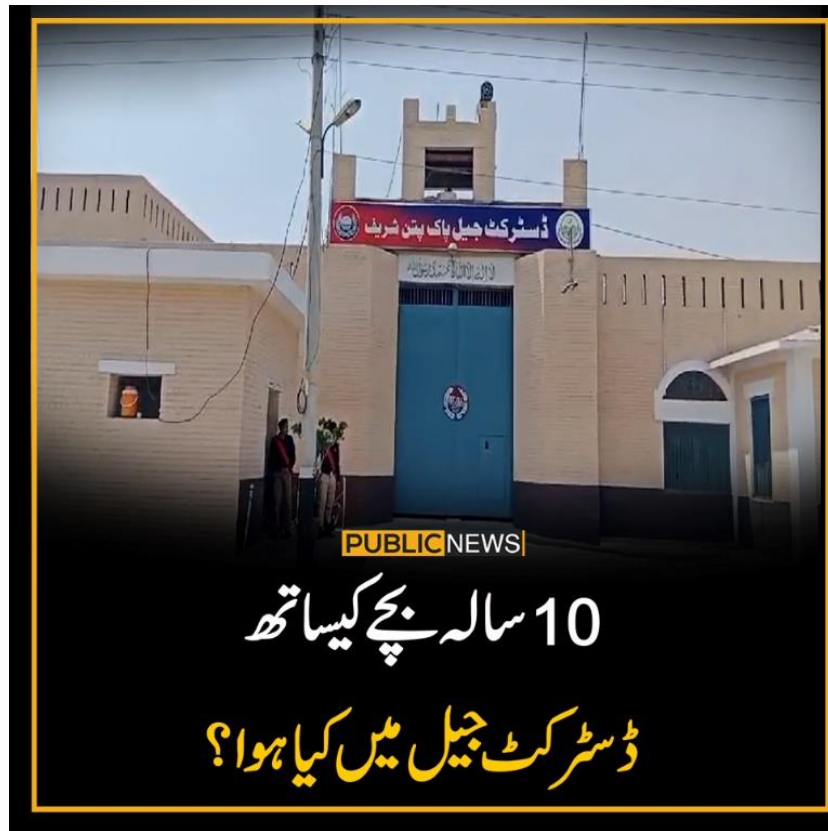
Getty Image of Pakpattan Prison

ہمیں "افضل" کے معاملے کے بارے میں ڈائریکٹر لاء کو بھیجے گئے ایک ای میل سے پتہ چلا جس میں کہا گیا تھا کہ 10 سالہ بچے کی پراسرار موت کو اجاگر کرنے کے لئے اسٹریٹجک کارروائی کی جانی چاہئے۔ تاہم، مقامی میڈیا ہاؤسز / اخبارات نے اس بچے کی افسوسناک موت کو اجاگر نہیں کیا تھا۔ جووینائل جسٹس ایکٹ 2018 کے نفاذ کی حمایت کے لئے قانون نے محتسب پنجاب کے دفتر میں کام کرنے والے چیف صوبائی کمشنر برائے اطفال (پنجاب) کو ایک اسٹریٹجک پٹیشن قائم کی تھی جس میں جیل میں بچے کی افسوسناک موت پر کارروائی کرنے اور پاکپتن جیل کے حکام / سپرنٹنڈنٹ کو نوٹس جاری کرنے کی ہدایت کی گئی تھی۔ اب یہ معاملہ 3 جولائی 2024 کو طے کیا گیا ہے۔ ہم آپ کو اس بارے میں اپ ڈیٹ رکھیں گے۔